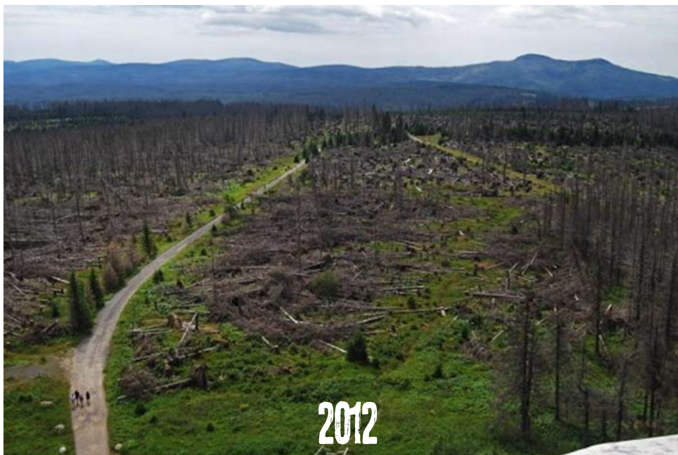
Poledník na Šumavě - pohledy z různých let a z různých úhlů