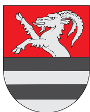
Bystřice pod Hostýnem

L A Ň – je symbolem mírnosti, něhy, dobra a klidu. Ležící stříbrná laň na modrém štítu zdobí erb městečka Rovensko pod Troskami. Původně byla ve znaku Nového města na Moravě, kde ji později nahradil lev. Zelený štít se třemi stříbrnými hroty a stříbrná hlava srny s krkem a se zlatým jazykem je znakem městečka Milovice.