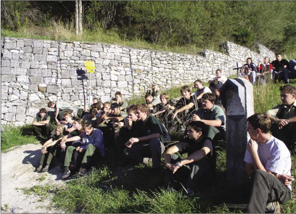
Skoro jako ve škole.

Již dlouho připravovaná exkurze naší třídy se stala skutečností. V neděli večer se všichni scházíme u autobusu se všemi nezbytnými věcmi. Po příjezdu autobusu a naložení všech zavazadel se rozpoutal boj o nejlepší sedadla. V autobusu všichni sdělovali své očekávání z těchto dvou zemí. Temná noc na sebe nenechala dlouho čekat a všechny uspala. Až ráno se probouzíme na francouzských hranicích celí rozlámaní.