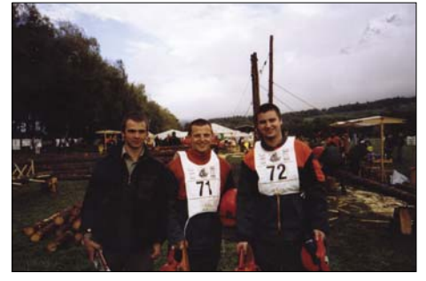
Reprezentanti naší školy na startu

To ano. Dojeli jsme kamsi do kopců, jejichž vrcholky příkrýval sníh. Vylezli jsme asi do dvou tisíc metrů