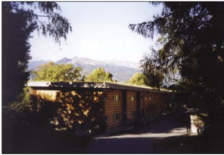
Internát lesnické školy v Maienfeldu

Čtyři žáci z naší školy měli tu čest účastnit se reprezentativní akce ve Švýcarsku, ve dnech 15. a 16. října roku 2004. Já nebudu zbytečně zdržovat a přistoupím k rozhovoru s jedním ze zúčastněných.