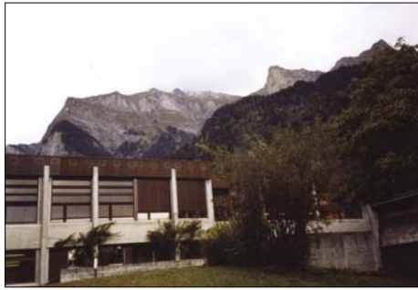
Budovy lesnické školy v Maienfeldu

Cesta ubíhala, no, já nevím ... Bez problémů. Z Písku jsme vyrazili na Strakonice, pak na Vimperk. Hranici České republiky jsme překročili na přechodu ve Strážném. Pokračovali jsme na Mnichov. Z Šumavy jsme se ocitli na velké rovině Německa. Překvapil nás zcela jiný ráz krajiny a přístup obyvatel k ní, což bylo i navenek vidět. Škarpy byly čisté a kolem silnice se táhly lány té nejlepší černozemě. V Rakousku jsme