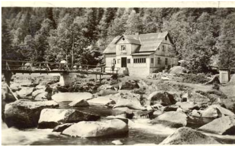
Klostermannova chata na Vydře, 1929

Jednou z posledních zastávek byl známý lovecký zámek Ohrada, který pro některé z nás představoval již dobře známé a atraktivní místo. Nachází se zde mezi rybníky Mulenovským a Zvolenovským výborná instalace oborů nám blízkých v podobě Muzea lesnictví, rybářství a myslivosti. Zámek byl vystaven v r. 1708-1713 v barokním slohu podle projektu architekta P. I. Bayera pro knížete Schwarzenberga jako lovecký zámek, který měl sloužit k pořádání honů a honosných loveckých slavností. První lovecké muzeum na Ohradě vzniklo již v polovině 19. století (1842), kdy tam byly soustředěny rozsáhlé sbírky loveckých trofejí a vycpanin a patří tak mezi naše nejstarší muzea vůbec. Dnes je možno v prostorách muzea zhlédnout bohatě malovaný hodovní sál s