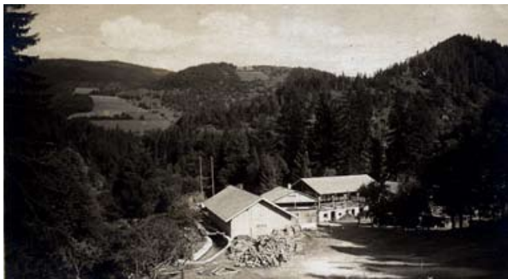
Čeňkova pila, 1932

Rokyta, kde jsme měli možnost zhlédnout také mineralogické sbírky související s učivem v druhém ročníku. Film o plavbě dříví z vyšších poloh Šumavy byl velmi poučný, protože se někteří z nás poprvé dozvěděli podrobnosti o dopravě dříví z šumavských horských pralesních hvozdů. Jak jsme se dozvěděli, plavení dříví trvalo až do poválečného období, kdy přetrvávalo špatné dopravní spojení s průmyslovou nížinou jihočeské pánve. Pro budoucí lesníky a lesní dělníky se zdá být zajímavé a důležité vědět o starých způsobech dopravy, pro nás nejdůležitější suroviny – dřeva.