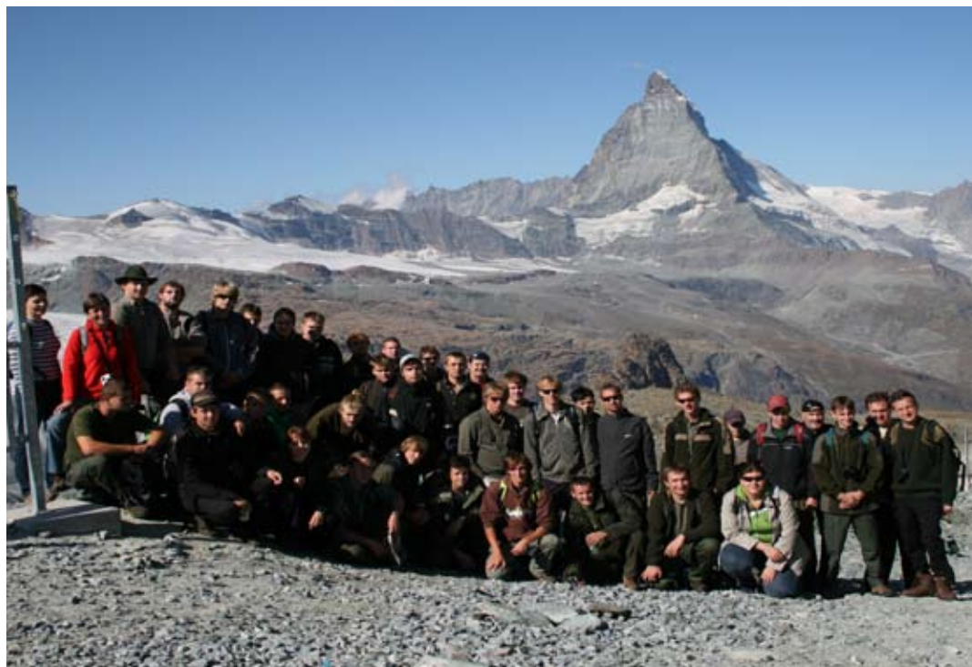
Společné foto, v pozadí Matterhorn

Zermatt je krásné město plné původních alpských roubenek, ale i hotýlků a penzionů, včetně mnoha hospůdek a re-