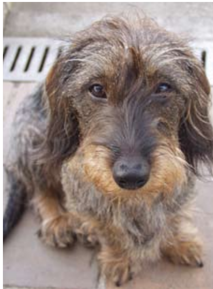
Emilka od sv. Huberta, ilustrační foto

Zpátky k nádražce. Jak to tak v některých nálevnách chodí, i tady se vyskytovaly nejrůznější druhy lidí, zvířat a ostatních individuí. Když jsem se rozhlédl, spatřil jsem opravdu pestrou směsici návštěvníků. Takovou, která se vyskytuje jen v nádražních putykách, v místech, kde se protkávají osudy lidí a zvířat, kde si navzájem na pár chvil vstoupí do životů, podívají se na sebe a potom se pohledem lhostejně rozloučí, aby se již nikdy více nepotkali. Je to místo, kde se na chvíli sloučí osudy všech přítomných a sváží se v jeden. Jak řekl klasik: „Poslušně hlásím, že život lidskej je tak složitej, že život jednoho člověka je proti tomu úplnej hadr.“ Tak se zde svázaly osudy