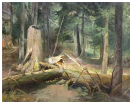
Šumavský prales, Josef Krejsa