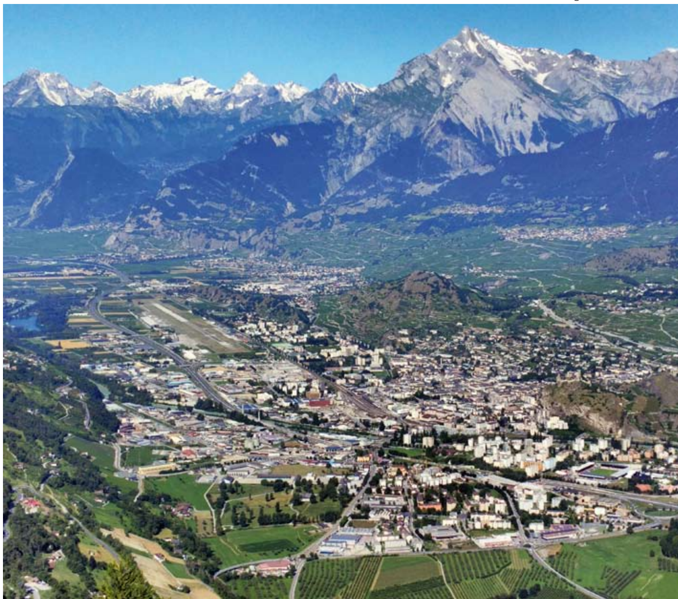
Sion, autor fotografie: Popo le Chien – Vlastní dílo, CC BY-SA 3.0