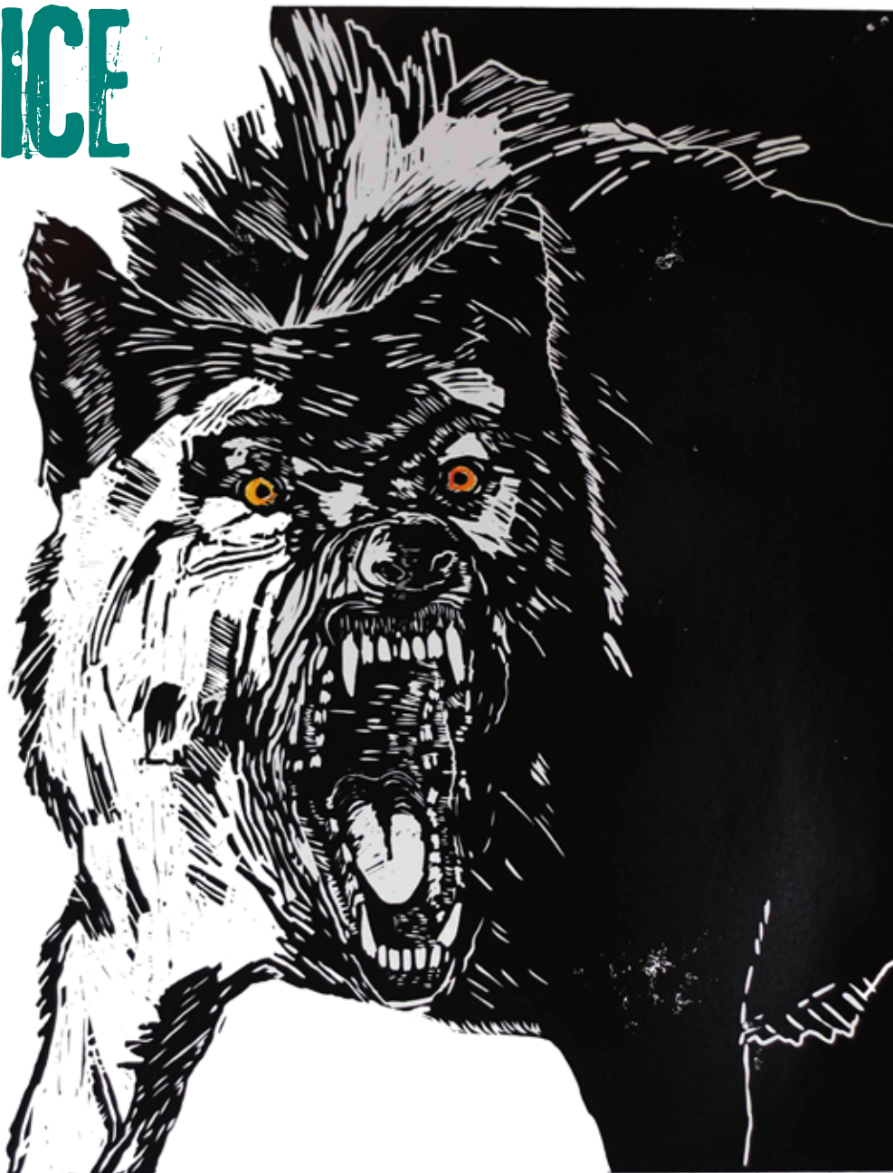
Doprovodná ilustrace, grafika ©Martin Salajka

Mohutný muž se zastavil u zvířete. Ukápla mu slza. Pohladil zvíře na srsti, na které se začal tvořit bílý povlak z jemných vloček, které začaly padat. Nenáviděl je, zabíjeli zvířata, která miloval. Teď konečně poznají hnutí Duha v té nejintenzivnější podobě, jakou kdy Šumava zažila. Nedají si říct a nedají. Už zlikvidoval tři. Výměnou za zastřelené zvíře, muž, který držel flintu v ruce, jak jednoduché. Naposled rukou přešel po tuhých štětinách, vložil zvířeti do úst zelenou větvíčku a otřel si pláčem zrudlé oči. Obrátil se k posedu a pohled mu potemněl. Chytl mladíka za nohu a surově ho strhl dolů. Marek dopadl