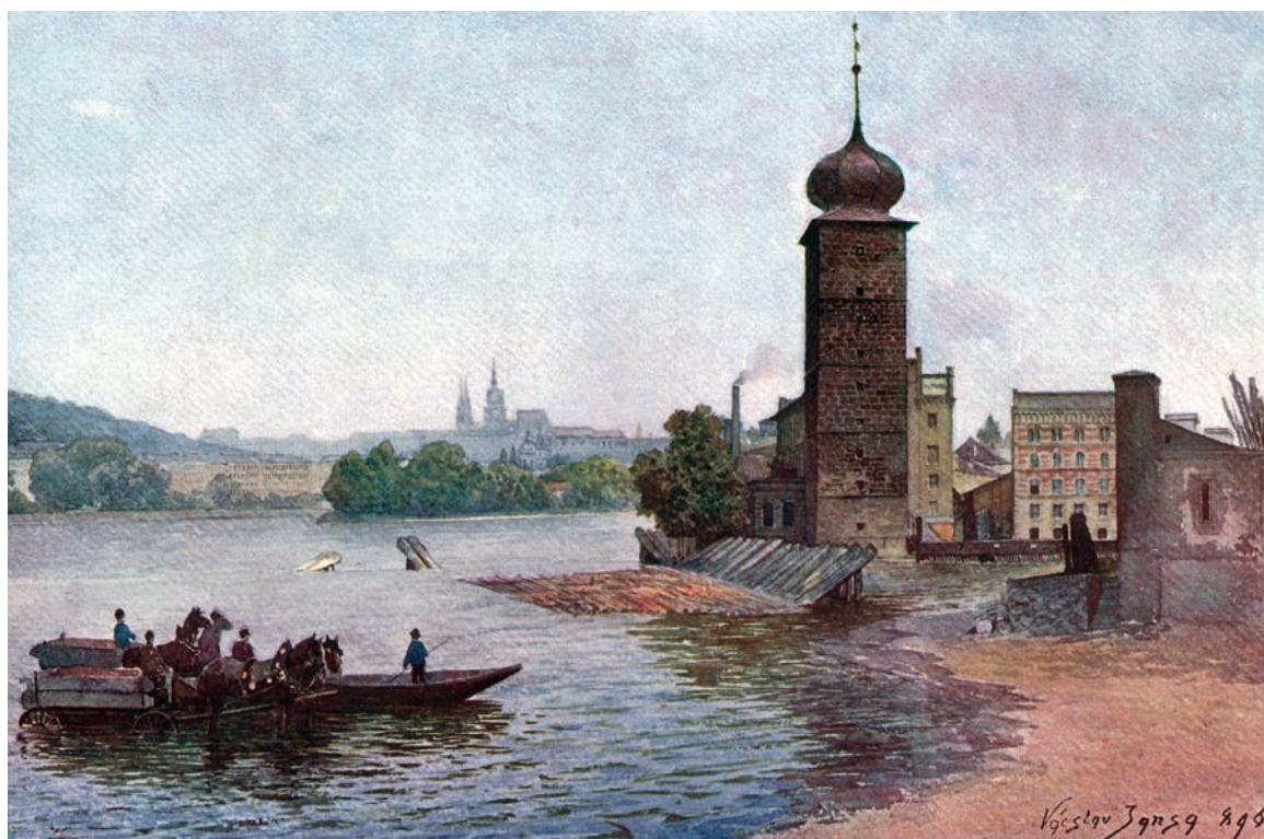
Václav Jansa - Stará Praha, Šitkouská věž