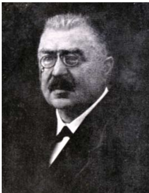
Ladislav Burket (1855–1933) První ředitel a zakladatel lesnických škol v Písku.

Na návrh lesmistra Josefa Zenkera a ředitele Ladislava Burketa zřídilo usnesením ze dne 9. října 1884 kuratorium zdejší rolnické školy „český běh lesnický k výchově a přípravě lesnických praktikantů k tzv. nižší státní zkoušce lesnické“. Administrativním ředitelem se stává Ladislav Burket a odborným ředitelem písecký lesmistr a lesní rada Josef Zenker.